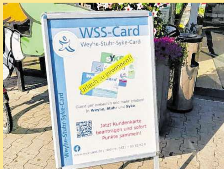
Mit verschiedenen Werbemaßnahmen macht das Unternehmen vielerorts auf die beliebte Kundenkarte und diverse Aktionen aufmerksam.

Weiter Informationen zur Weyhe-Stuhr-Syke-Card gibt es im Internet unter www.woehlike-stuhr-syke-card.de sowie auf www.facebook.com/WeyheStuhrSykeCard und instagram.com/wsscard .